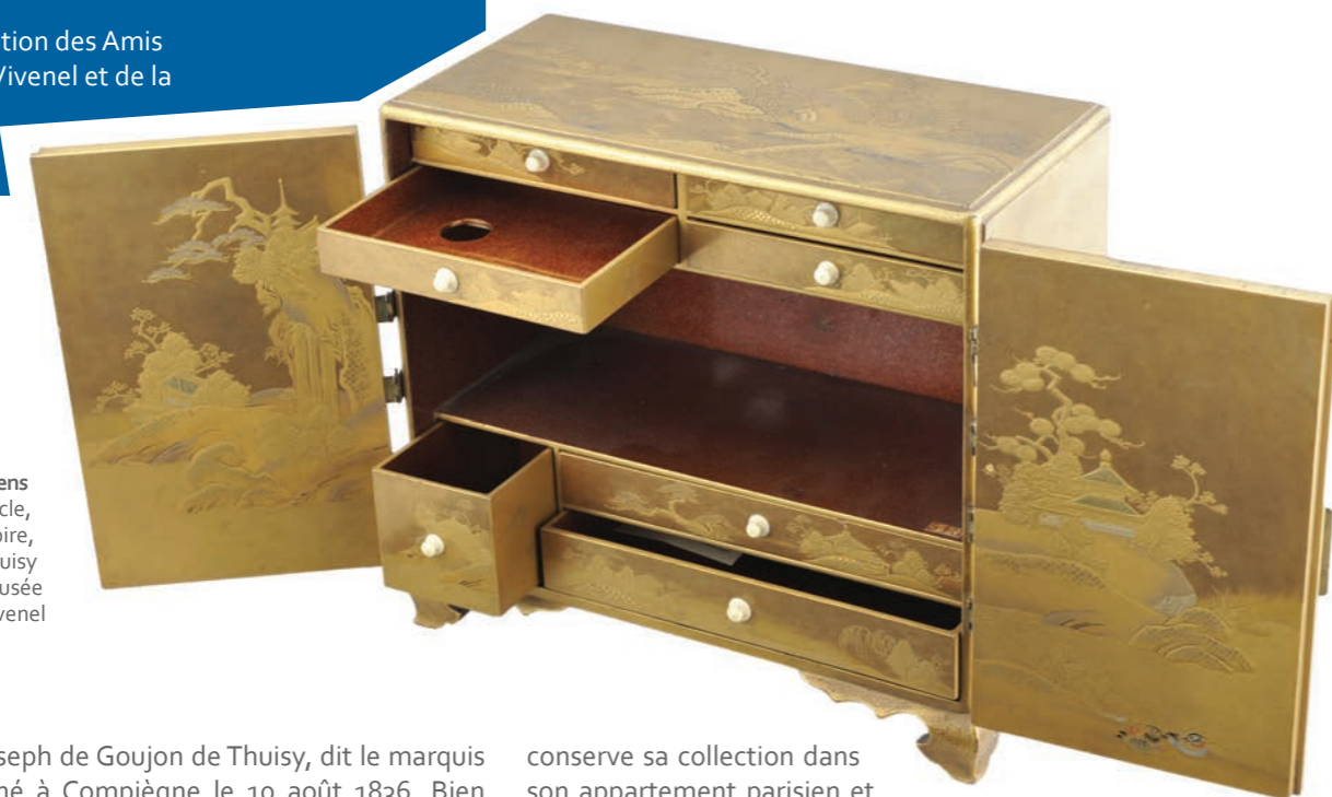
Cabinet pour le jeu de l'encens Japon, XVIII e siècle, Laque, or, métal et ivoire, Legs Thuisy

Le catalogue des majoliques italiennes du musée Antoine Vivenel de Compiègne paru en 2011 sous la direction d'Éric Blanchegorge et de Céline Lécuyer, est disponible à la boutique du musée.