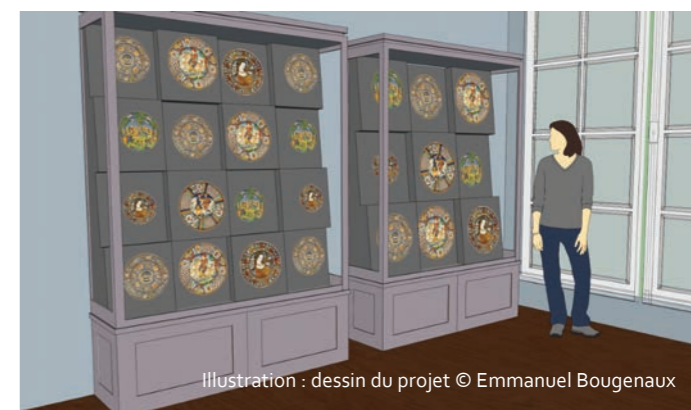
Illustration : dessin du projet © Emmanuel Bougenaux

orchestrée par le socleur Emmanuel Bougenaux. De cette manière, la vocation décorative et narrative de cette vaisselle italienne composée de faïence lustrée aux couleurs éclatantes, produite pendant la période de la Renaissance, aux XV e et XVI e siècles, et destinée à l'ornementation et à l'apparat, va lui être rendue. L'occasion de donner un coup de projecteur sur ce fleuron des collections du musée.